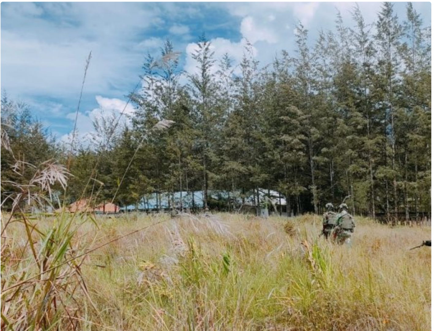
Satgas Yonif 323 Amankan Anggota OPM terduga pelaku tindak Kriminal

Satgas Mobile Yonif 323/Buaya Putih Kostrad berhasil menangkap salah satu anggota Organisasi Papua Merdeka (OPM) yang diduga terlibat dalam sejumlah tindak kriminal di wilayah Papua, Kabupaten Puncak, Penangkapan ini dilakukan