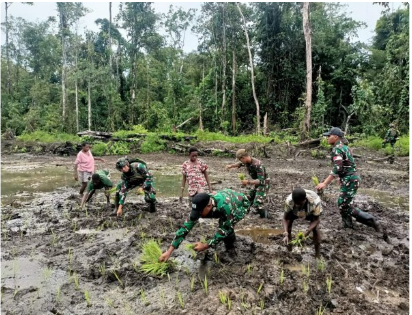
Foto: Satgas Pamtas Mobile RI-PNG Yonif 503/Mayangkara menggagas program ketahanan pangan yang melibatkan langsung warga Kampung Mumugu, Distrik Krepkuri, Kabupaten Nduga, Selasa (07/01/2025).

NDUGA- Dalam upaya membangun kesejahteraan masyarakat di wilayah penugasan Papua Pegunungan, Satgas Pamtas Mobile RI-PNG Yonif 503/Mayangkara